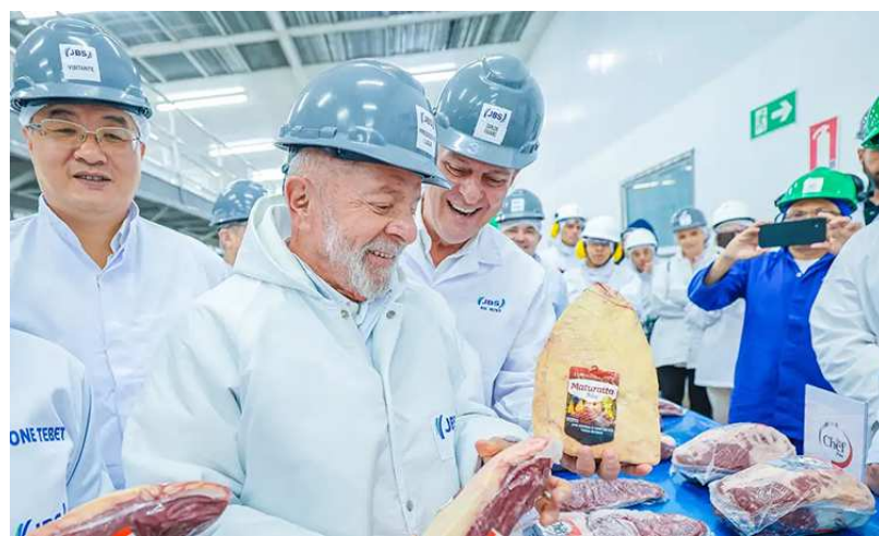
Lula em visita a JBS de Campo Grande para exportação de carne para China no dia 12 de abril de 2024

Outros 81 estão destinadas ao campo da Saúde: 37 Unidades Básicas de Saúde, seis Unidades Odontológicas Móveis, cinco Centros de Atenção Psicossocial e duas maternidades com Centro de Parto Normal (CPN), além de 26 ambulâncias