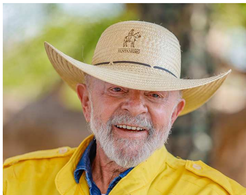
Presidente da República, Luiz Inácio Lula da Silva, durante visita à Base Prevfogo/Ibama de Corumbá e diálogo com brigadistas da Brigada Pantanal, em Corumbá no dia 31 de julho de 2024.

“Temos uma missão nesse país. Temos o compromisso de melhorar a vida desse povo e de entregar esse país crescendo. O dado concreto é que o Brasil vive um momento excepcional do ponto de vista do crescimento econômico, do ponto de