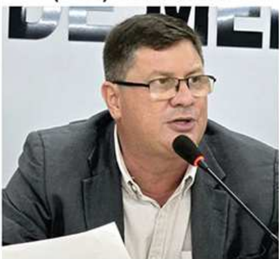
5º Bira (PSDB) 1.143 votos